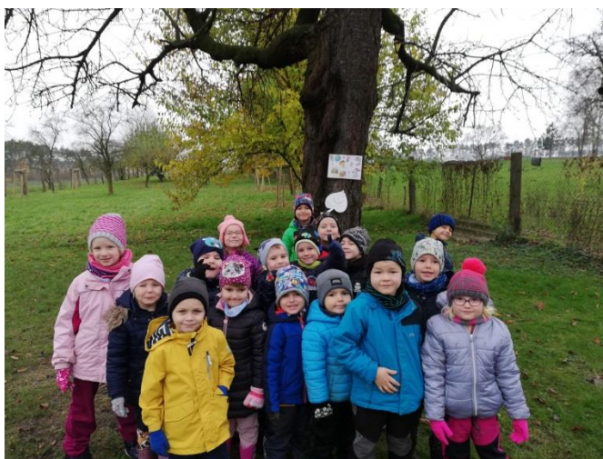
Hledáme skřítku Podzimníčka