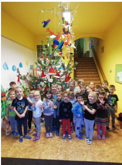
Těšíme se na vánoce